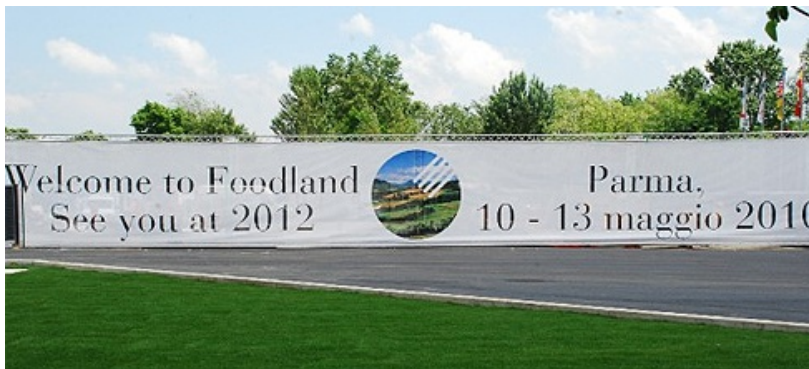
Cibus 2010, Salone Internazionale dell'Alimentazione